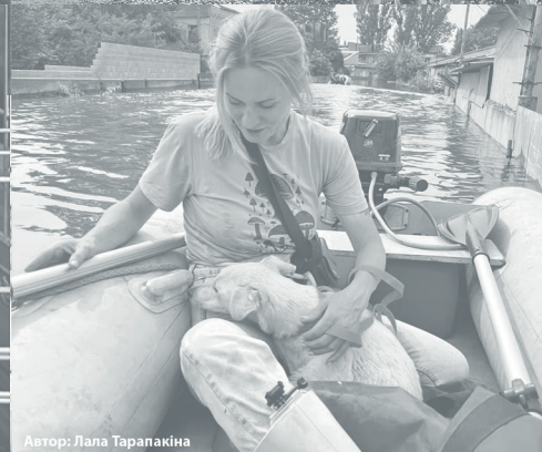
Автор: Лала Тарапакіна